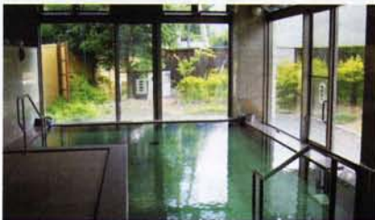
壁一面のガラスで外と仕切られた開放感いっぱいの浴室