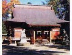
地元の人々からは「若宮様」と呼ばれ、親しまれている

允恭(いんぎょう)天皇(433年ごろ)の創建といわれる。佐良志奈とは「信州更級(更科)」の古代表記。志賀直哉の小説「豊年蟲(ほうねむし)」でこの神社が描かれている。 ☎026-276-6138 国千曲市若宮2 国境内自由 国無休