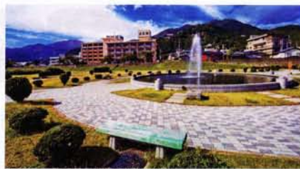
夜のライトアップは4月から11月