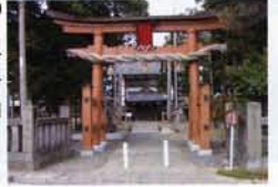
現在の社殿は寛政元(1789)年に建造されたものといわれている

諏訪大社の流れをくむ一間社流造りの本殿の全面に、さまざまなモチーフの彫刻がダイナミックに施されていて、圧倒される。本殿は国の重要文化財に指定されている。 ☎026-275-5180 (千曲市教育委員会文化課文化財係) 国千曲市戸倉1990 国境内自由 国無休