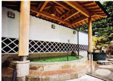
開場明治36(1903)年の歴史ある日帰り湯

善光寺詣りの精進落としの湯として発展した千曲川のほとりに広がる温泉街。50以上の源泉を持つ豊富な湯量を誇る。美人の湯としても知られる。夜の街を彩る芸妓衆も名物の一つ。