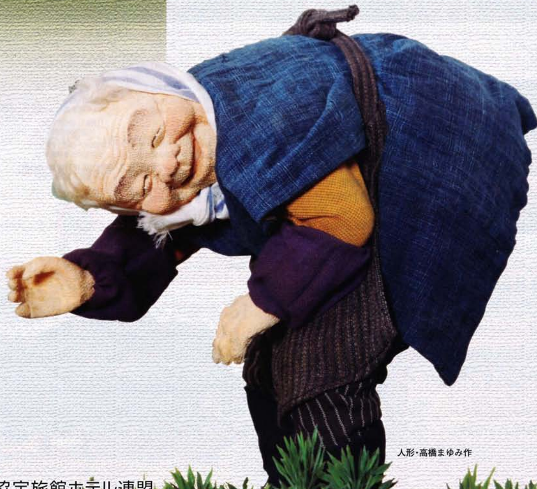
人形・高橋まゆみ作