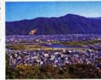
雄大に流れる千曲川と戸倉上山田温泉街が一望できる

☎026-275-6653 (城山史跡公園管理事務所) 国千曲市上山田3509-1 国9時~17時(入園は~16時30分) 国入園300円 国12月28日~1月3日