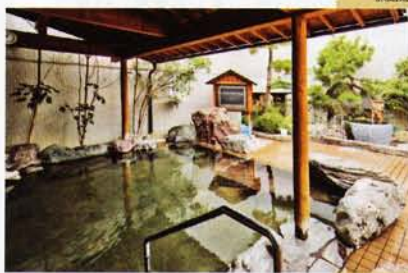
露天風呂にテレビが備え付けられている

☎026-276-4664 10時～23時(入場は～22時30分) 360円 毎月16日、月末