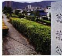
五木ひろしの「千曲川」の歌碑もあり、ボタンを押すと曲が流れる

万葉橋のたもと、千曲川沿いに広がる公園には、古く万葉の時代から現代に至るまでの信濃を歌いあげた27の歌碑が建っている。川風に吹かれながら、ゆったりとした時間が過ぎる。