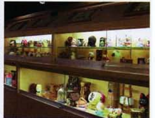
懐かしい貯金箱と出合えるかもしれない

平成20年4月にオープンした日本でも数少ない貯金箱専門の博物館。館長が金融機関に勤務しながら、集めた6500点の貯金箱が順次展示されている。江戸時代や海外の珍しい貯金箱からおなじみのキャラクターものまでそろっている。 ☎026-213-4612 千曲市上山田温泉3-10-5 入館600円 9時～17時30分(入館は～17時) 月曜(祝日の場合は翌日)、年末年始、展示替えの期間