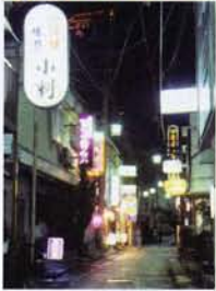
昔ならではの温泉街のお楽しみスポット

お座敷が終わった芸妓衆や浴衣姿の観光客がそぞろ歩くネオン街は、射的場や大衆演劇場もあって、ノスタルジックな雰囲気にあふれている。